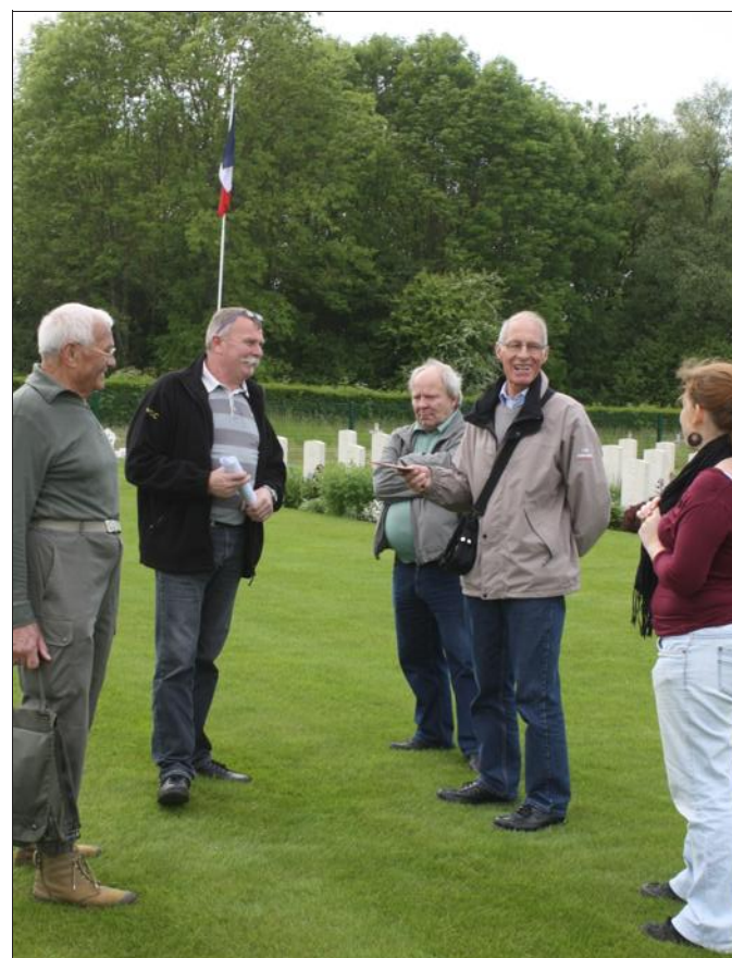
Au cimetière de Choley-Ménillot, en territoire anglais.